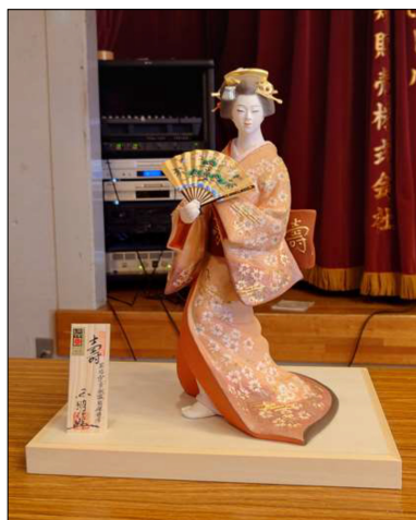
40周年委員会*姉妹クラブ委員会記念品、博多人形