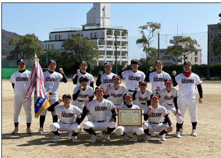
優勝 行橋市立泉中学校