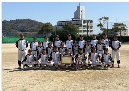
準優勝 行橋市立行橋中学校